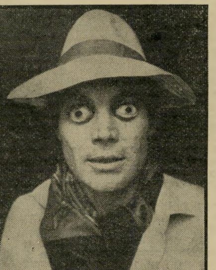
בראנדאור במחזהו של שניצצר מישחק זה התמודדות

קארפנטר הוא נציג אופייני של הדור החדש של קולנועני אמריקה, הוא שאף לעשות סרטים מאז הצליח להגייט ידיו, בגיל 8, על המצלמה הקטנה של אביו. בחצר האחורית של בית המישפחה, במ" דינת קנטאקי, צילם, ערך והפיק כל מיני סרטי אימים וסרטי מדע בדיוני, מן הנוסח שבלע בצמא בטלוויזיה. מאוחר יותר הצטרף לפקולטה לקול" נוע של אוניברסיטת דרום קליפורניה, הדבר שהלחיב אותו שם יותר מן השי-