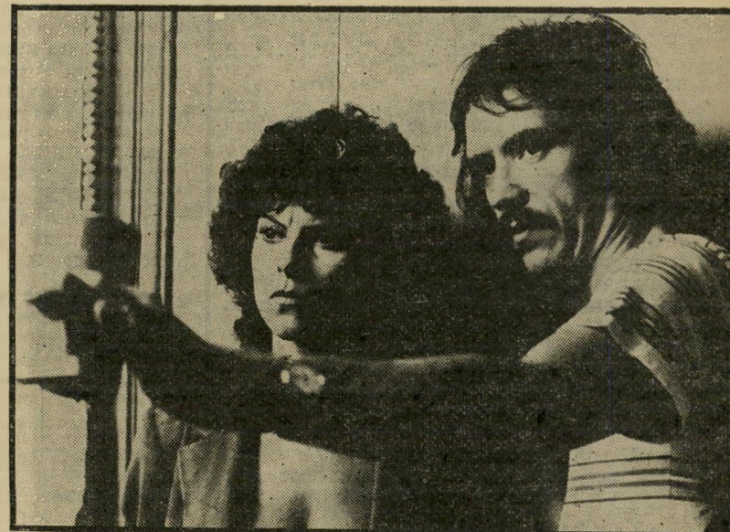
בימאי ג'ון קרפנטר מדריך את אדריאן בארבו ב"בריחה מניו-יורק" בעשבות הוקס והיציקוק

מרות שהוא בן 32, ישנם מבקרי קולנוע רבים שהפכו כבר את ה" בימאי האמריקאי ג'ון קארפנטר, לפולחן. הם סבורים שהוא אחד המאורות הגדולים של הקולנוע האמריקאי החדש, ומקבלים כל אחד מסרטיו, כולל הבריחה מניו-יורק (שיוצג בקרוב קס בישראל) כאירוע.