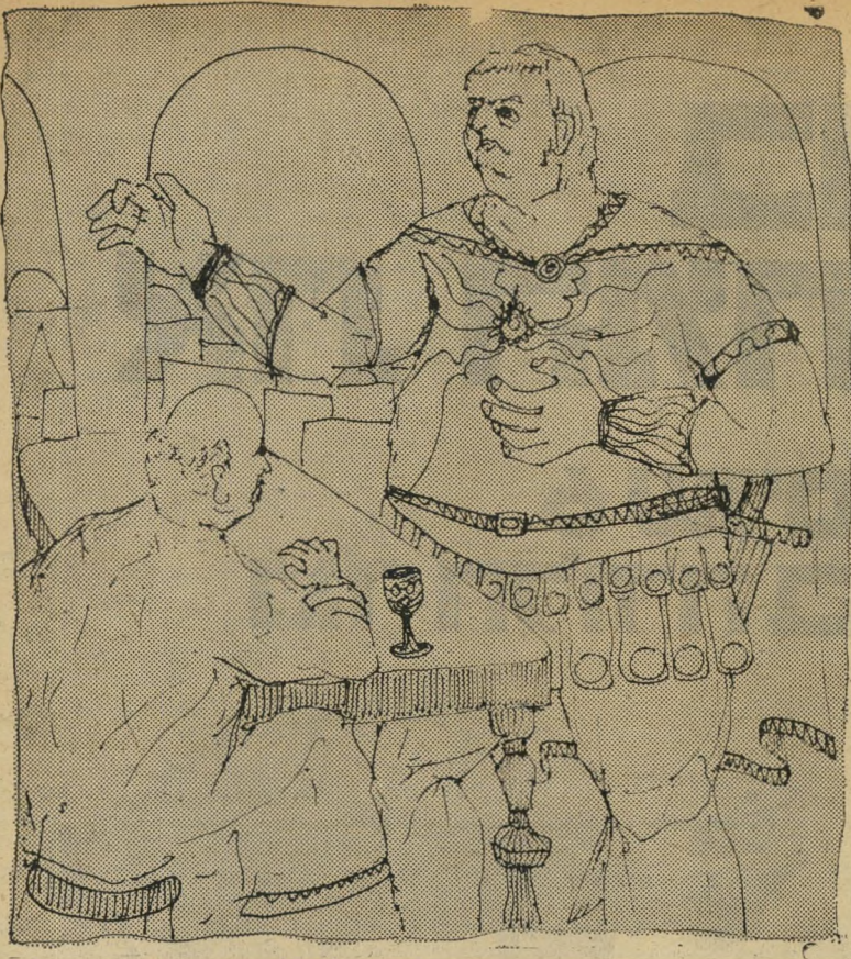
אני קלאודיוס וארוטס אגיפטוס תמיד אדם שלישי

צריך להיות איש צעיר מדי, כי לאנשים צעירים עדיין יש ג'וקים בראש, ותפקיד מבקר-המדינה מחייב אדם בלי ג'וקים; אך אסור מאידך שמבקר-המדינה יהיה ממש זקן נוטה-למות, לכן ברור שמב-קר-המדינה צריך להיות בעל ניסיון-חיים עשיר, אחד שמכיר את העולם הגדול. אבל אלה באמת שיקולים מישיניים. מה שחשוב באמת הוא שמבקר-המדינה לא יכול להיות איש דתי לגמרי מה-מאפ"ל, כי הם קיבלו את נגידות בנק ישראל, והוא גם לא יכול להיות איש חירות כי הם קיבלו את ראשות-הממ"ק שלה. הוא לא יכול להיות מהמערך כי הם קיבלו חזק, והוא לא יכול להיות