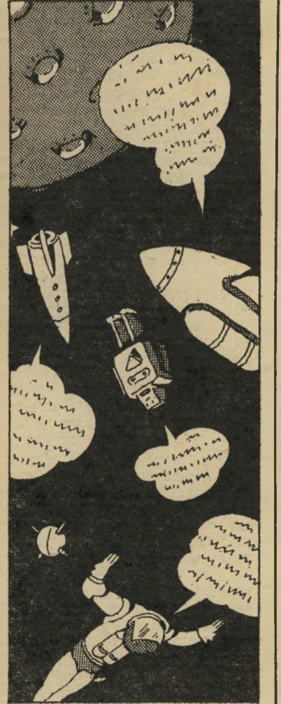
מסע דייונים בחלל יציאת מצריים חללית

מעולה, עם מוסר-השכל בעל השלכות מיידיות על כדור-הארץ, על הקינאה והתיסכול המהווים קרקע-גידול לגזענות, תהא סיבתה אשר תהא. זה ספר מעולה, שחסרונו העיקרי הוא בתרגום הלוקי שלו. סידרה של מילים שהקרא עשוי למצוא בספר, כמו: בכבוד; המיגע; ייכרו; בו; לתנכן ועוד מילים רבות, אינן מילים מיוחזרות ממילון המדע-הבדיוני, אלא שיבושים ושגיאות-הגהה, שבת-הוצאה כמו כתר אינו ראוי לתיר לעצמו.