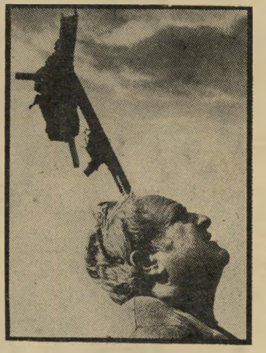
תומרקין וצליבת האדמה אלון מורה... אלון סוף

יגאל תומרקין - עצים, אבנים ובדים ברוח; הוצאת מסדה (כריכה קשה + תצלומים רבים בצבע).