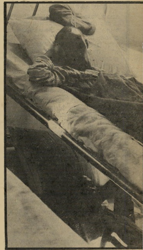
קומוח"ים מחוסר מקום שרר עים החולים על הי מיטות, ועל מזרונים המונחים על הרצפה.

סיפור זה אינו דימיוני. הוא מציאות. מציאות הקיימת ב„רפובליקה הבופוטצו-וואנית“, חבל-ארץ בדרום-אפריקה, שה-שילטון הלבן העניק לו עצמאות-כביכול. יושבי החבל חיים בכפרים נחשלים, ללא חשמל וללא מים. חנויות אלה ודומות להן עובר כמעט