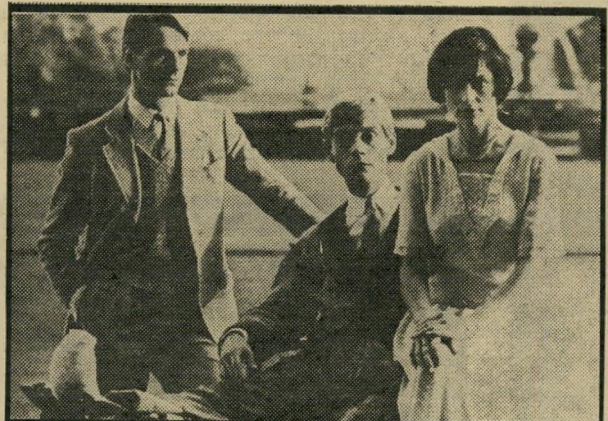
קוויק, אנדריוז ואירונם: חמדת ימים יום שני, שעה 10.10

מדע בידיוני: הקור צי החלל (6.15) — שיר דור בצבע, מדבר אנגי לית). לאחר קרב החלל הי גדול המתנהל ליד כוכב שבתאי, נותרו רק חלוצי חלל להגן על כדור הארץ, והם מחליטים להנחית את הארנו לשם תיקור נים.