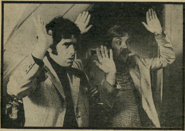
סאתרלנד וגולד: מרגלים (יום שישי, 15.1)

ביום שישי (15.1) יקורן סירטו של ארווין קירשנר, "מרגלים", כיכובם של אליוט גולד ודונלד סאתרלנד, שניהם סוכני סיאיי-איי אמריקאים הפועלים בפאריס, ואינם יודעים זה על קיומו של זה.