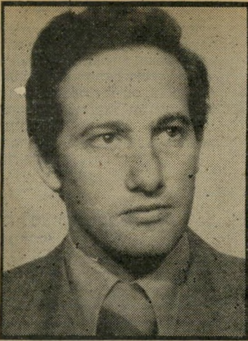
כתב צבאי בני-ישי עבודה קוטמת יותר

ש'רהביטחון, אריאל ("אריק") שרון, הציג לפני שבועיים לכתב הצבאי ולראש השולחן לענייני-ביטחון של הטלוויזיה, רון בני-ישי, הצעה מפתה למדי: תפקיד של יועץ-שר ודובר-על, הממונה על דובר צה"ל ודובר משרד-הביטחון כאחד.