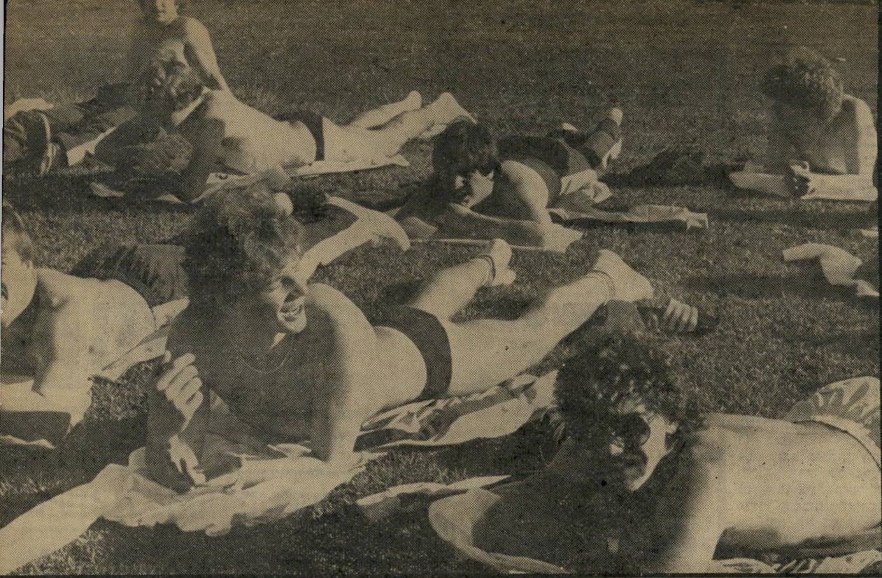
שחקני שווייץ משתזפים על המיגרש בפתח-תיקוה הרעב לשמש

את מכבי תל-אביב אנחנו בנינו, והיום הם בונים אותנו. התחלנו להקדיש דקות שידור רבות למכבי תל-אביב כשזו היתה עדיין אלמונית, אך בעלת פוטנציאל. היום, אחרי שהפכה פעמיים אלופת אירופה, כל