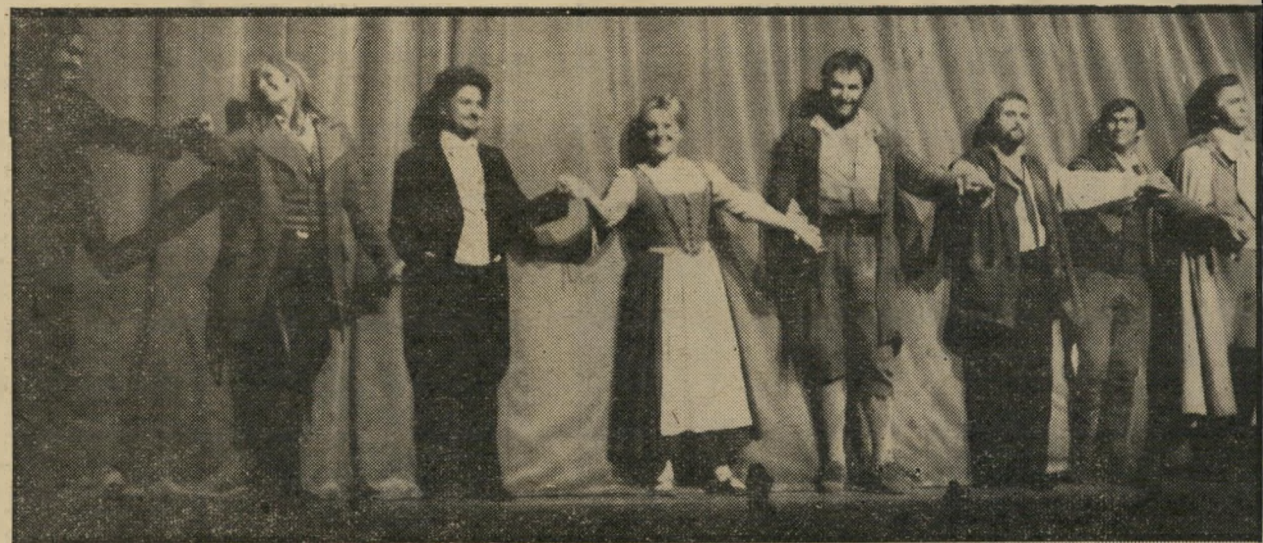
מנצח שר שרון עם שחקני האופרה-הממלכתית של וינה „תל-אביב חסרה לי”

אבל לחיות שם זה לא בשבילי. אני יודע? בסוף אני עוד אמצא את עצמי חי שם. אבל אני באמת לא יכול להיות שם יותר מדי זמן.