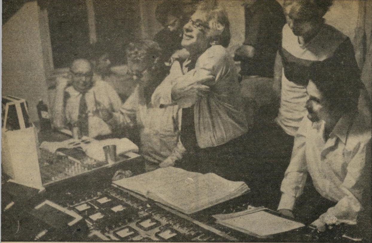
מנצח שרון (מימין) עם מאסטרו ברנשטיין (באמצע) בהקלטה „ארבעה מיליון איש היו אסיסטנטים שלו”

● לא נמאס דך להחליף כל הזמן מנצחים חוקים? נכון אמנם, שהם