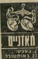
21 בספטמבר - 22 באוקטובר

המתח שאתם חשים בביתכם בזמן האחרון מביא אתכם לרצות לשנות את סדרי הבית. קניית רהיטים חדשים, או שיפוץ רצון לייפות את מקום המגורים. אורחים בלתי צפויים עשויים להגיע, ובבית תהיה תנועה רבה. נסו להימנע מוויכוחים ומדיבורים מיותרים. גם שאלות מרגיזות לבן-הזוג עלולות לגרום ל'מריבה ואפילו לפירוד. נסיעה פתאומית העשויה להתרחש השבוע, תהיה מעניינת.