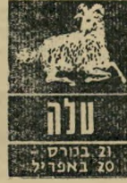
21 ביוני - 20 באפריל

בתחילת השבוע צפויה מתיחות בעבודה. תגובות נמהרות והתפרצויות רוגז עלולות לגרום לבעיות ועיכורבים. רצו להתאמץ ולדחות בכמה ימים את התשובות חשובות. גם בבית לא תרוו נחת, הנטייה למריבות מתגברת ובן-הזוג אינו מוכן לוותר ולהתרכז. אלה שתיכננו נסיעה לחוץ-לארץ, יתכן שית'אכזבו, אך זוהי אכ'זבה לזמן קצר, והכל אמור להסתים בטוב. אורחים בלתי צפויים יפתיעוכם.