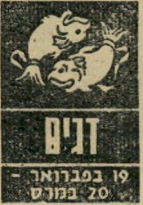
19 במרץ - 20 במרץ

בעיות כספיות יתרידו אתכם השבוע. נסו לקחת פחות סיכונים, ולהעז לטוב ליד-ידים המבקשים הלוואות. קשר לעבודה אינו נ'אות בסנות הגשמה שבוע זה, ולפעמים נ'מה שלעולם לא תוכלו להשיג את מבוקשכם. מתיחות ביניכם לגורם ידידיכם עלולה לגרום לציפוף קשרים זדירים. רצו להיות זדירים, ולא להתעקש להתחיל בפרשיות אהבה חדשות. בתוך זמן קצר העניינים יסתדרו.