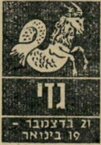
21 בדצמבר - 19 בינואר

השינוי שחל במצב-רוחכם מושך אליכם שוב ידידים וקרובים. שוב נעים להימצא במחיצתכם ולהנות מ'מסירותכם ונאמנותכם. הוסנתם למסיבות יוציא אתכם מהבידוד שלהן והרגלתם לאחרונה. קנו לכם בגד חדש ומושב וצאו לטיולים, הפעם גם לכם צפויה הצלחה. מבחינה כספית המצב משתפר והתחייבויותיכם לא צריכות להדאיג אתכם. תוכלו להתגבר ולהחזיר את כל החובות. משימות חדשות יוטלו עליכם.