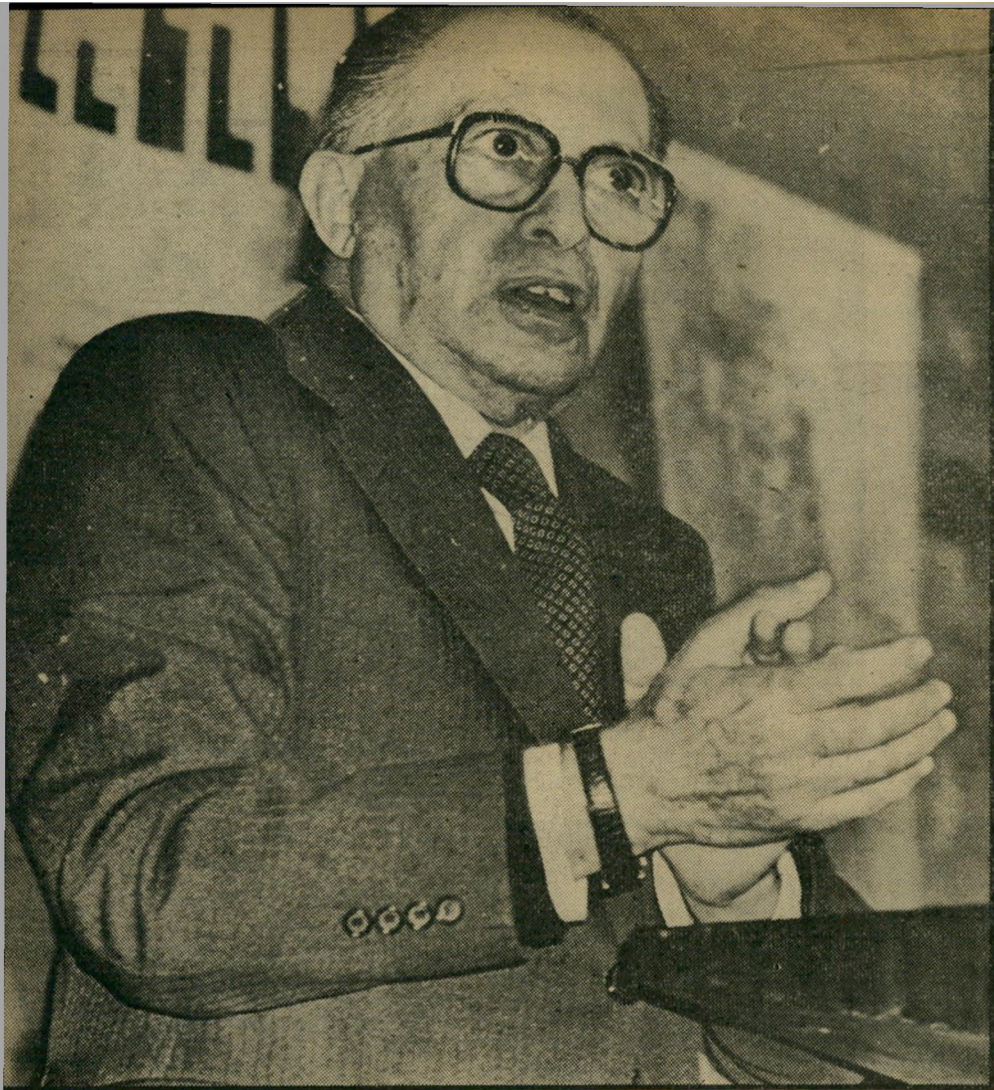
ראשי הממשלה רפובליקת בננות

לניהול משאומתן בשלב כלשהו אינו מבטל את ההחלטה. הוא יכול להצדיק, לכל היותר, את המשך הכיבוש עד להשגת הסכם.