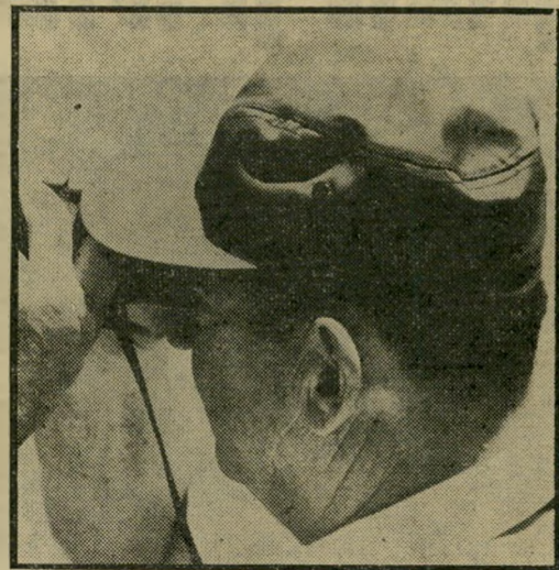
יו"ר-הרשות יפה והסיירת הידוקה

הוא היה חוזר תכופות על החוכמה שלו: "בעצם, אתם צריכים לשלם בעד הזכות לעבוד בעבודה הזו ולא לקבל עבורה שכר". ואכן, הצליח לגייס קבוצת