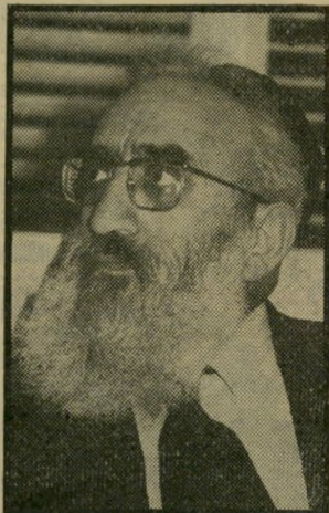
רב גורן והעצמות

כלבת הבוקר עלולה לעמוד במצבים לא נעימים. לכלבת-הבוקר שלי, קליאו, יש הרגל מוזר: מדי יום, בעת טיולנו הקבוע בשדרות רוטשילד, היא מחפשת אחר עצמות. כיצד אוכל להסביר לקליאו, ש-אסור לה לגעת בעצם כלשהי, לפני