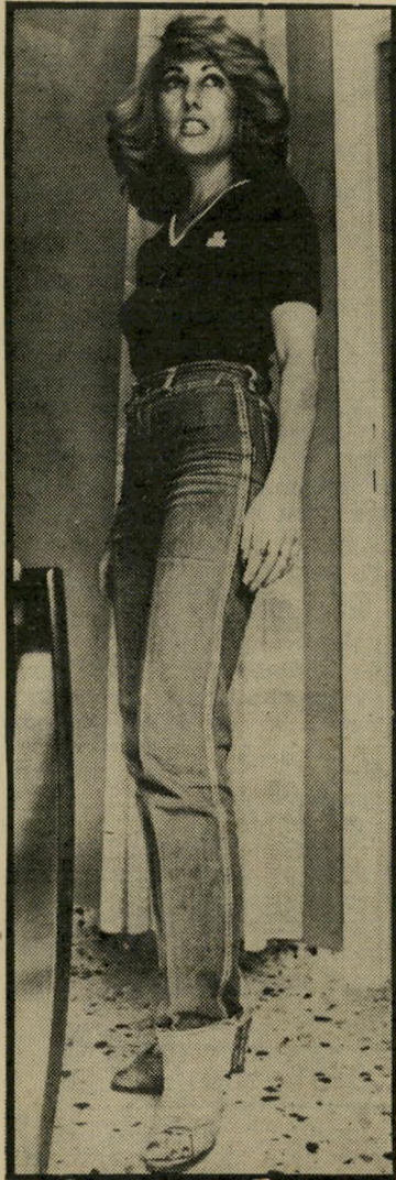
שרכנית זרדי „העסק הנבחר 1982“

במישרדים הגדולים ביותר בארץ לא ניש-אים במשך שנה יותר משניים-שלושה זוגות. וזאת עם כל הרצון הטוב של בעליהם.