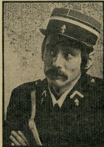
ויקטור אנרי דה-וויז, אנטי-שמיות מתחילת המאה

הירהור מוזר זה עלה במוחי, משום שבימים אלה שיגר אלי חבר שנמצא בפאריס מיסמך מעניין מאוד. אותו חבר יושב לו בסיפריית "הסורבון", ודולה