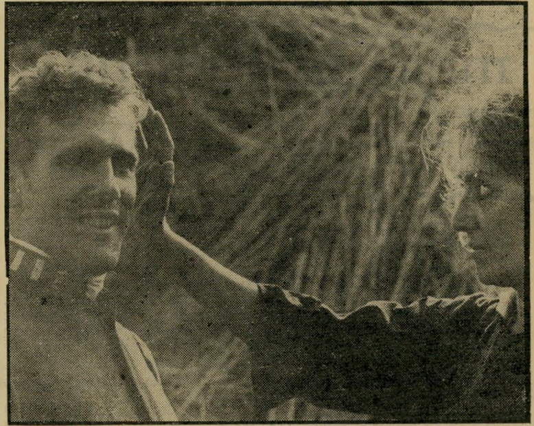
שחקן ז'ראר דפארדייה ב„1900“ של ברטולוצ'י דיאלקטיקה פוליטית שקופה

רומנטי למילחמה במימסד, נוסח רובין הוד במאה ה-20, וכדי שלא להתחייב בשום נושא, הם מוצאים לעצמם מיפלט בתוך עולם של תיאוריות והכרזות רע-שניות, המלוות בכל צבעי הקשת של האסתטיקה. יש להניח שרווי צודק, אבל, גם אם מה שעומד מאחורי המרדנים הללו הינו