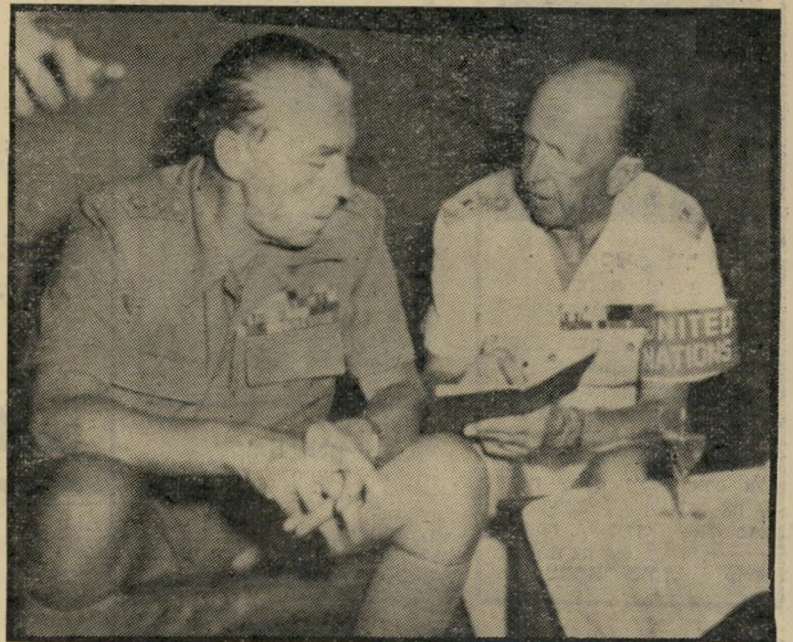
הרוזן ברנאדוט (משמאל) עם עוזרו בירושלים זכויות רוחניות בירושלים

"עיתונים מדווחים על שתי אוניות שעזבו את מארסי עם עולים צעירים ונשק. עלינו להמשיך ולשמור על קיומה של הפסקת האש ותנאיה, אחרת נואשם בהסגת החוק הבינלאומי. דבר זה יזיק למצבנו הכללי, אני משוכנע שאתה תדאג להתנהגות הולמת של כל נציגינו בכל מקום. חיים וייצמן." ביוני 1948, ירשה ברודוס ממשלת ישראל בראשותו של ראובן שילוח, וניהלה משאומתן עם מותוך האו"ם למזרח-התיכון, הרוזן פולקה ברנדוט.