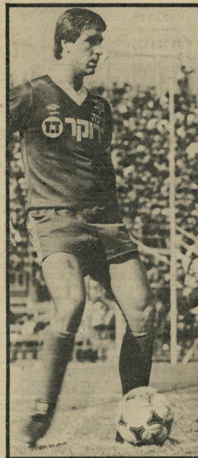
כדורגלן פרסלני אגדה שהתנפצה