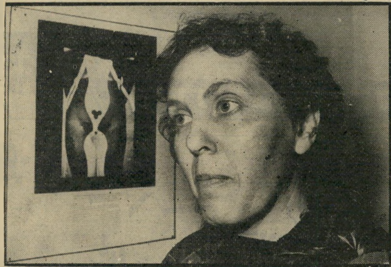
פמיניסטית גידעדי ליד תמונה של גוף אשה „יצירה של פמיניסטית חשובה יותר!”

ומה בדבר הטבע? מה בדבר הצורך הטבעי לקיים יחסי-מיני עם בני המין השני? „יש נשים בתנועה הפמיניסטית, שהחליטו לא לקיים יחסי-מיני עם אף-אחד