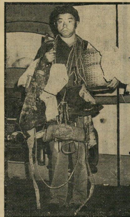
בודו כמוישה ונטיילטור (1960) בין לילה כוכב

בודו לא הסתפק בכך. הוא חש שמשאו חסר לו. העובדה שנחשב כ"חלטוריסט" שיטחי הפריעה לו, והוא חיפש דרך להר-כיה שהוא שחקן רציני, ושהקומדיה היא רק טעם אחד נוסף, שגם בו הוא יא-לט היטב. כשהוקם תיאטרון חזיפה, קטף יוסף