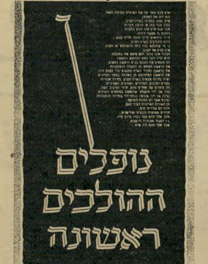
עמוד הפתיחה וכתבה על הנופלים משמאל קטע מהכתבה

היה נדמה כאילו יקרה דבר נורא אף מן המעשה עצמו: שלא יימצא שום גוף