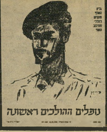
נופלים ההולכים ראשונה

גליון "העולם הזה" שראה אור השבוע לפני 25 שנה בדיוק היה גליון ה-1000 של השבועון. תחת הכותרת "נופלים ההולכים ראשונה", החל השבועון בפירסום מונטרפיות קצרות לזכר הנופלים במערכה. במדור "הנדרים" התייחס עורך השבועון, תחת הכותרת, "כל העם צבאי", לייחוד של צה"ל מול צבאות אחרים. כתב השבועון עמנואל פרת תיאר כרטיסות, "המדת עולה לפניה", את המדענים שהגיעו למינור מטרה קתרינה לבוסק את אוצרותיה, כפרם יחזור הציריאי סיני לירי המצרים. מדור הספורט של השבועון דיווח על כישלונה של מישלחת ישראל