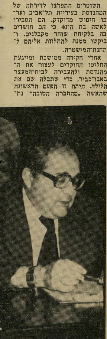
פרקליט פרוטם "את שוטר נחמד..."