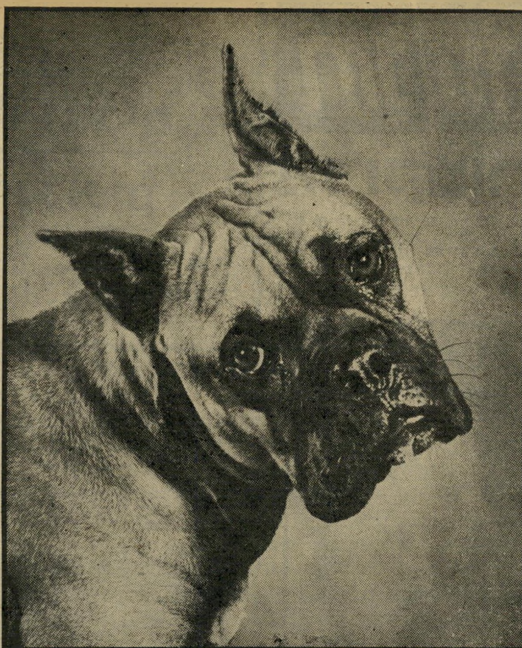
ראשו של כלב בוקסר למה נטפלים אליו?

נטפלים בדרך כלל לשני נושאים עיקריים: ילדים וחיות-בית. בדרך-כלל מתלוננים אנשים חסרי-ילדים על ילדי השכנים. הדופי קים, מרעישים, מלכלכים, מתעללים והופי כים את חייהם לגיהנום. אנשים חסרי-חיות טוענים שכלבם של השכן עושה את צרכיו בחדר-המדרגות, הורס את הי גינה, מייבב ביום ונובח בלילה, ו/או מתקיף את האורחים ומפחיד את השליח מן הסופרמרקט. כדאי היה לאנשים המשתעממים בגפם להיעזר בכלבי-ידיד ולא להתנקם בו על לא עוול בכפו.