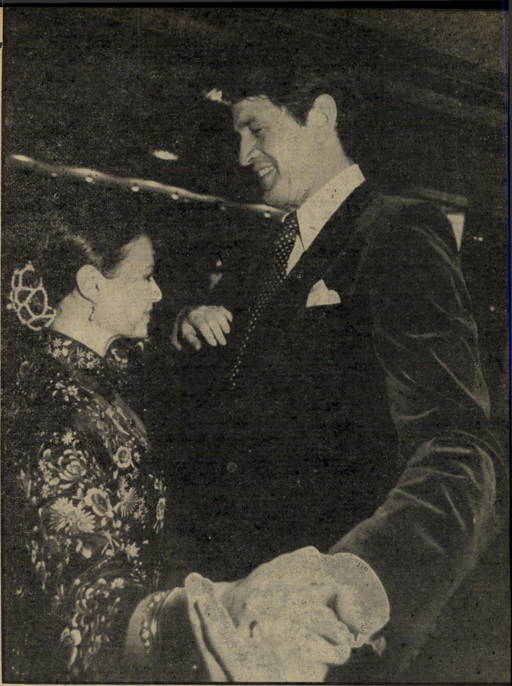
הוא חבר הקונגרס מזה תשע שנים, וחבר בוועדה לענייני רכש, בא לארץ יחד עם שישה חברי-הקונגרס נוספים. מכאן המשיכו חברי המישלחת לריאד.