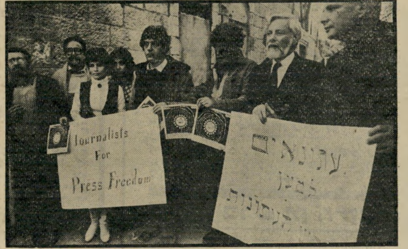
ההפגנה בשערי "אלי-פג'ר" שימוש מועט בסעיף דראקוני

"חוק העיתונות" משנת 1933 הוא חוק דיקטטורי. הוא נולד בדיקטטורה היקולניאלית הבריטית, ואחת מטרתו: להבטיח את הדיקטטורה מפני כל ביקורת או התקפה עיתונאית. עצם המשך קיומו במדינת-ישראל הדמוקרטית הוא חרפה. מובן מאליו שאין דומה לו בשום מדינה בעולם, המתיימרת להיות דמוקרטית. הסעיף 19 בחוק זה אומר כי הנציב העליון (ומאז 1948: שר-הפנים) יכול לס' גור כל עיתון כראות-עיניו, אם פירסם חומר שגראה לו (לשר בילבד) כמסוכן ל-