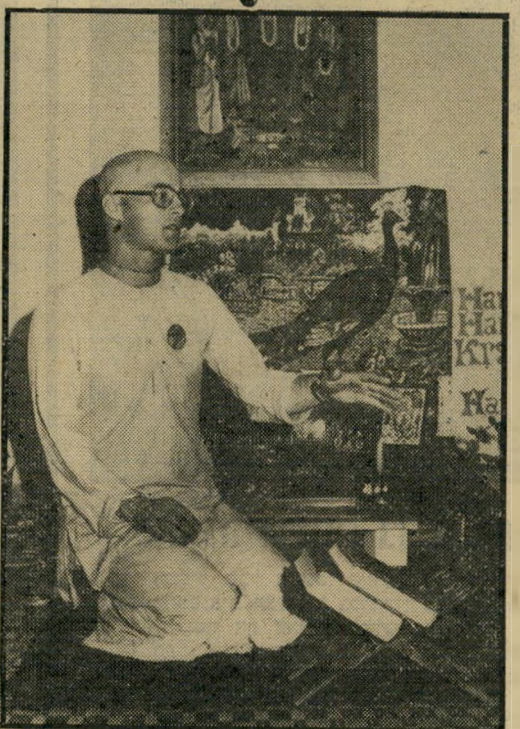
חבר כת הרי קרישנה בישראל פיאות נוכריות בבית ז'אן ז'אק רוסו

רגשות אנטי-סובייטיים. הממשלה השמרנית ביפאן איננה ניטראליסטית. היא נקרת עתה בין המסורת האנטי-מילחמתית שנוצרה ביפאן מאז הירושימה, לבין מדיניותה הפרו-אמריקאית המסורתית. השיפור הרב ביחסים עם סין תורם אף הוא להרעה ניכרת של היחסים עם ברית-המועצות. הממשלה מיטיבה לשחק על הרגשות