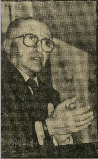
מנותח בנין מדבר

לסתום את הפה! היא כנראה מא-מין גדול באימרה: אהב את הדי-בור ושנא את המלאכה. ג. מנגו , רמת-השרון