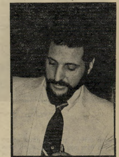
בנקאי רקאנטי מניות ללא אישור

כדי להסביר מה קורה בבורסה השבוע, צריך להסביר תחילה מונח בורסאי: שורט (באנגלית — "חסר" או בעברית, "מכירה בחסר"). כדי שהסבר יהיה חלק וגם מעניין ומהימן, נזקקתי ללכסיקון לניירות ערך, שבו כתוב בין היתר: "מכירה בחסר — מכירת מניות כאשר הן אינן בבעלות