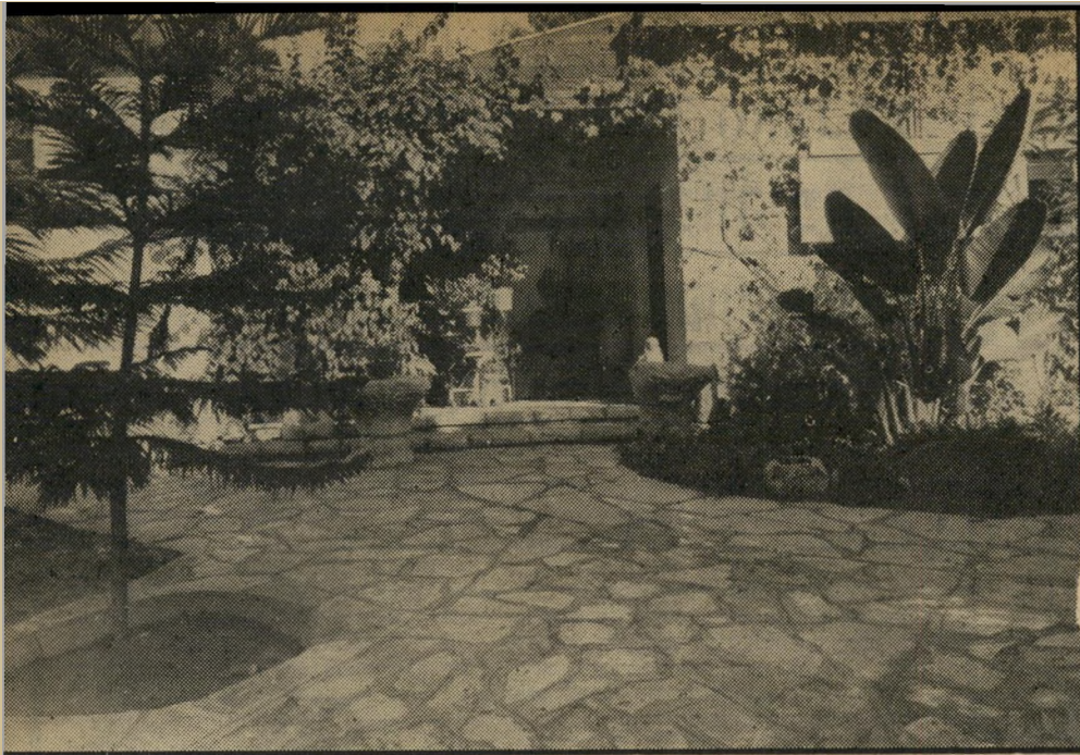
עבור משה ורות בתחילת שנות החמישים, אך דיין שילם לרות את מלוא תמורתו עם גירושיו. למרות זאת, הסכימה רחל לשלם את מחצית ערכו, 30 מיליון לירות, לבניו של דיין, יעל, אודי ואסי.