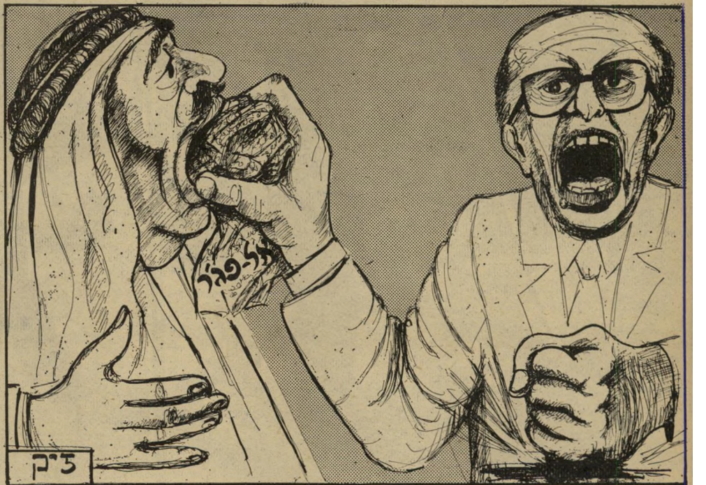
"רק אחד יכול לדבר!"

ה סימן הראשון לכך שמשוה מתרחש בין ילדיו של דיין ובין אלמנתו, היה באזכרה שנערכ