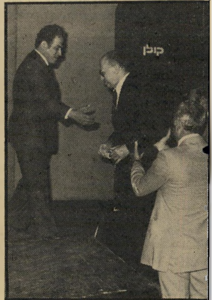
בגין, יום לפני ההתמוטטות* חשש מפני —

ה רופאים משתדלים גם שבגין לא יתרגו, כי גם להתרגויות עלולה להיות השפעה קטלנית עליו. עוריו ביקר