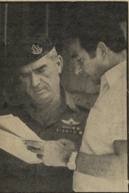
מנכ"ל מעיין והרמטכ"ל לא רוצים בבוס