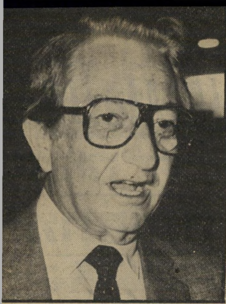
יורד ריקלים ישלם משכורת שניה

אריק שרון אינו מתפעל מהביקורת ש-הוטחה נגדו מפאת מינוי יורד ואדם שהשתמש ממילחמות-ישראל לתפקיד כה בכיר וכה רגיש במערכת הביטחונית. הוא