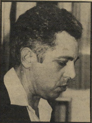
מושל מיצנוף הוועד מתנגד