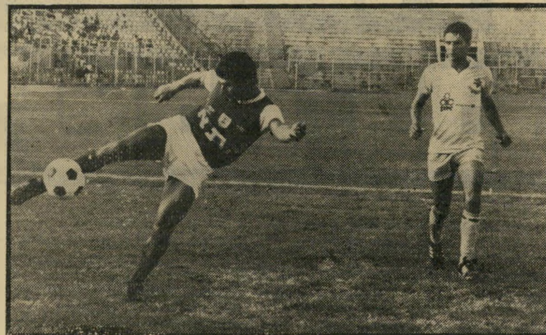
שחקן דרייפוס כמגן ימני מנהלי-האגודה פשוט מתעלמים

הקפטן הפורש אינו משיב לקריאות הטלפוניות של ידידים המבקשים ממנו לשוב למיגרש. "אני יותר מדי אוהב את