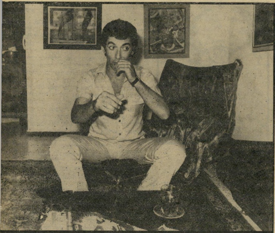
אבט של אנזובה

רוצצת בין בית הוריה ובין אחיה הרבים המנסים לעודדה ולחזקה. ברוח טובה סיכמה אתי את הנושא: „למדתי לקח. בפעם הבאה לא אתחנן מהר כליכך. אבדוק קודם טוביטוב עם מי יש לי עסק.“ מיכיל זכרונני