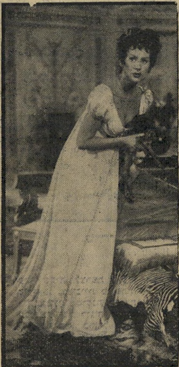
שחקנית מארטיין קארול הכוכבים הופיעו כמעט בהתנדבות

הדבר המעורר היום את התפעלות האינדי סליגנציה האמריקאית הרואה את נפוליאון. אבל הוא גם העז להכניס לסצינות אלה משמעויות מטרידות. אחד המעמדים הר מפורסמים ביותר באני מאשים (1919), סרט על מלחמת העולם הראשונה, מראה שדה-קרב שלם, שהפך לבית-קברות, ובו קמים החללים לתחייה כדי לתבוע את עלבונם מן החיים. שהפכו את קורבנם קורבן שווא, בכך שביזבוז את השלום שהוענק להם.