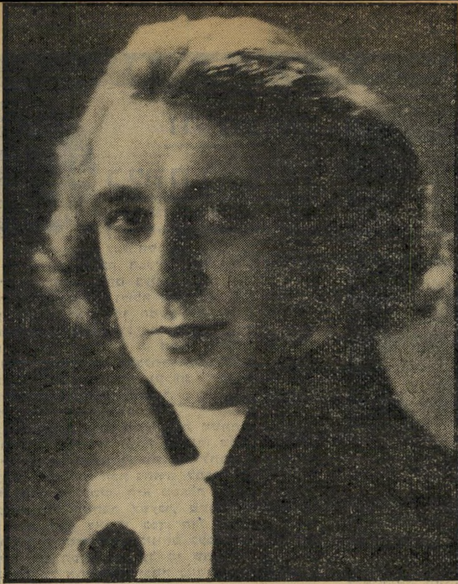
הבימאי אבל גאנס כגיל 38 ובציודים האחרון לפני מותו, כגיל 92