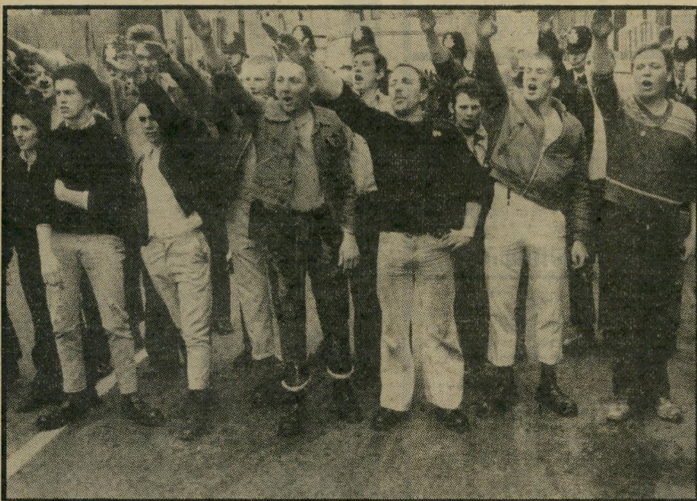
מינכטרים בריטיים בהפגנה נאצית פנים אחרות לאנגלים

חגיגה-המולד קודר נוסף קרב ובא על שלושה מיליוני המובטלים בבריטניה. במרכז הערים הגדולות מסתובבים אלפי צעירים בחוסר-מעש ובחוסר-תיקווה. הם מהווים טרף קל להסתה גיועית. ניאו-נאציזם, שחזר ברכבת ללונדון מספר עיתונאי-ספורט הודי, שחזר ברכבת ללונדון מספר