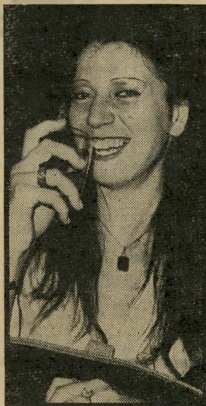
קוראת יראי-ספטמנקי מי שבא מבין

תגובתה של ממשלת-אוסטריה - אלם ודומיה. תגובת ממשלת- ישראל - אלם ודומיה! הגיע הזמן שממשלת-ישראל תחדל מן ההפרדה האיומה בין