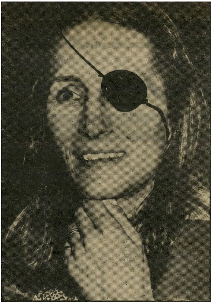
בת יעד והירושה