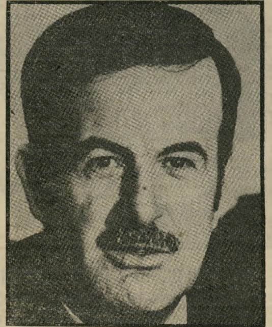
נשיא סוריה אדי-אסד מסגיר שמאלנים לכלא התורכי

קשה להסביר את כל הדברים היפים האלה ל-40 אלף האסירים הפוליטיים בתורכיה. המישטר הפוליטי של הגנרלים אינה נופלת בכושר המצאתה מהגסטאפו הנאצי או מהסאוואק של השאה האיראני. הדו"ח של אמנסטי אינטרנשיונל בנושא זה היה חד משמעי: התורכים מפעילים שיטות עינויים מחרידות, הכוללות מכות