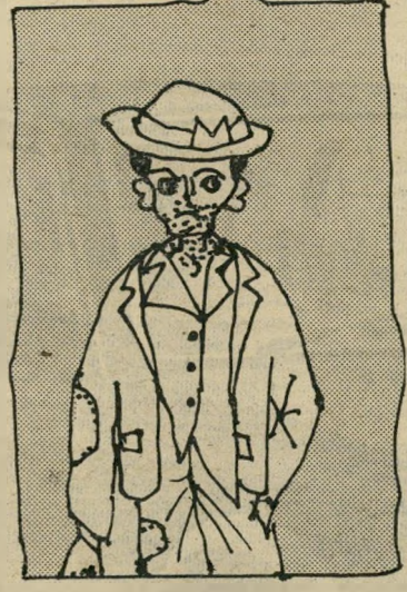
עני אמיתי 7 ק 200

וביגלל שזה בדיוק מה שאני חושב, כליכך מצא-חן בעיני מאמר שכתב הפרשן הכלכלי של עיתון "הארץ", אברהם טל, תחת הכותרת "כיצד נוספו רבבות עניים". אברהם טל בטח חושב כמוני, אבל לא מסביר את מחשבותיו בצורה כליכך וולגארית כמו שאני עשיתי-כאן, אבל בשפה יפה, כמו שרק נרשן לכלכלי יכול.