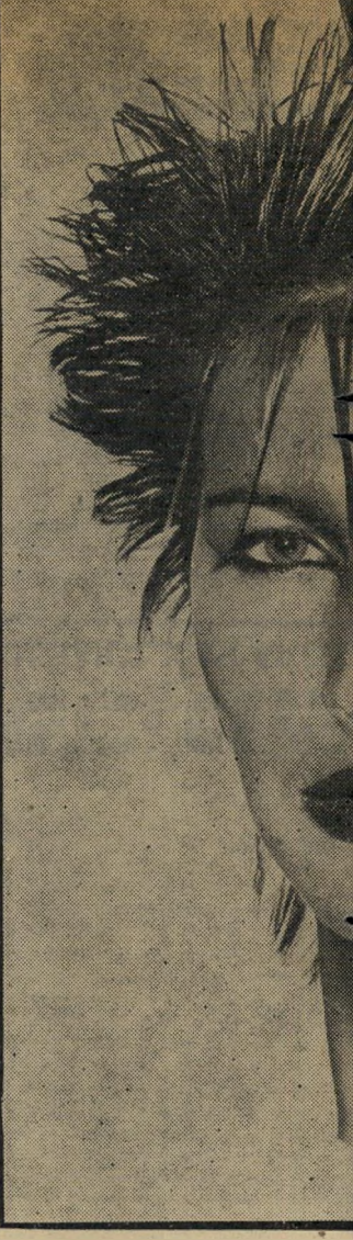
מאוד אופנתית בקיץ, אינה שיהייער קצת ארוך, עוזר לנו חום אדמדם וחום אפרפר.

מה פיתאום? אצלנו נתונים לו לצאת, ועוד איך. פשוט מבקשים ממנו לצאת, כל-כך רוצים שייצא, שאם הוא בעצמו לא מוכן לצאת, פשוט מוציאים אותו, ואחר-כך מתפלאים שהוא נושא נאומים אנטי-ישראלים בניו-יורק! עם כל הכבוד לסובייטים ולנסינים הארוך בשדה השילטון והמימשל, כדאי להם ללמוד מהנו גם מאיתנו, הקטנים. מה שטוב לפאהד קוואסמה, טוב גם לאלכסנדר פריצקי.