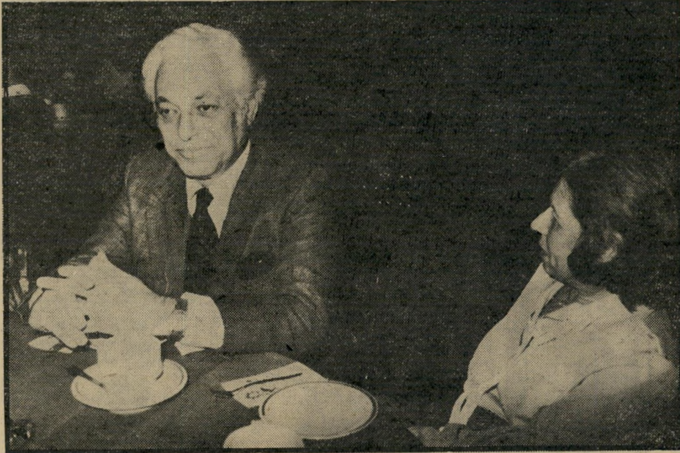
אסירי-שעבר צור ואשתו

ובכל זאת, לא כולם שוכחים לו את עברו. כשנסע באוטובוס לירושלים, הציע לו אחד הנוסעים מקום ישיבה, נוסע אחר ש"השיגרה."