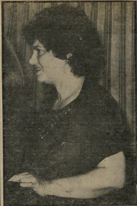
פמיניסטיות עיון ועסקנית סנהדראית "סקנדליסטיות! אתן סקנדליסטיות!"