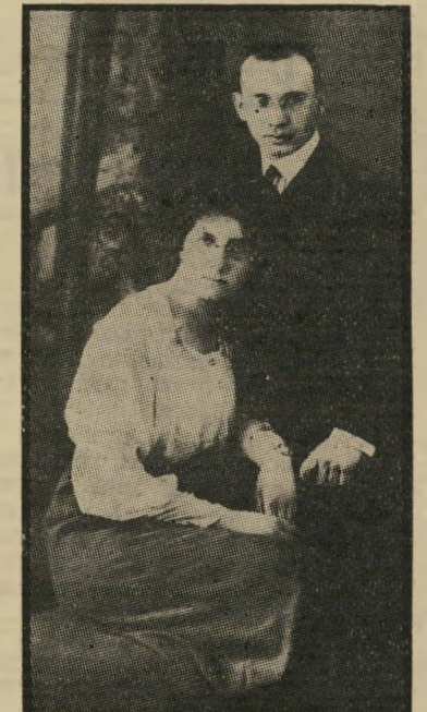
מאוזכרת מאיר * אידישע מאמא גלובאלית

בעיקבות בגוריון פוסע מוכירו הפרטי לשעבר, וכיום נשיא המדינה יצחק נבון, המתגבר על רגשותיו כלפי ראשהממלה בדימוס, אשר מנעה בשל סיבות שלא נבעו מטוב לב את בחירתו של נבון ל- משרת נשיא-המדינה, בימי שלט המערך בארץ. נשיא אחר של המדינה, זלמן שז"ר, מעניק להערכתו את גולדה את הכותרת המנצחת, אלא שגם כותרת זו, קדמה בשלוש שנים לנצחונה ביום-הכיפורים 1973. דברי הערצה אפולוגטיים, כי יאות לדור הבנים הסרים, מביא יגאל אלון המנחה, תחת הכותרת נאמנות לעק- רונות ודבקות במטרות, אלו, בניסוחו הר- מנומס, מתעלם מחלקה של גולדה, כי