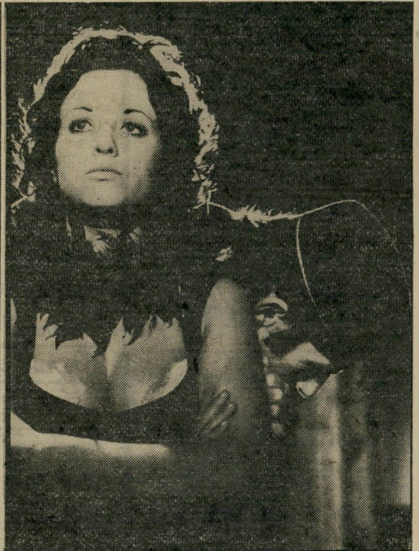
אבירמה גורן ב"מורים קאזאנובה" (1972) ועכשיו