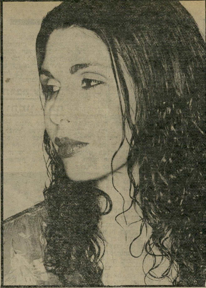
גורן כיום, כיועץ יופי