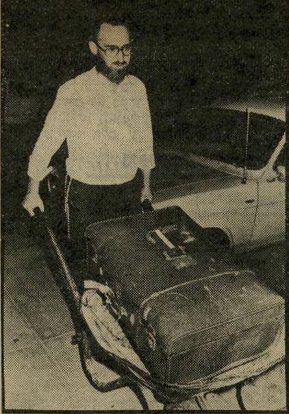
מתנחל מגיע למוטל בימית החשמל לא ינותק

"אורחים יקרים. לצערנו, חיבוקכם הפך להיות חיבוק דובי, אשר עושה מה שטרם הצליחו ממשלות ישראל ומצריים לעשות - לאץ את תושבי העיר האמיתיים לעזוב את בתיהם. באינו זכות אתם מכנים אותנו בוגדים במולדת, מודעלים ברעל הכסף, ומייעצים לנו לקחת את הפיצויים ולהסתלק כבר היום מבתינו? היכן הייתם במשך שש שנות הבניה של העיר? לא היינו מעולם ישוב הפגנתי שהוקם בפלישה לא-חוקית. ואנחנו לא מעוניינים להיות כאלה. אנא, שבטובכם, צאו מתוכנו, אל תסרידו אותנו, אל תכפו את עצמכם עלינו, אל תכבדו עלינו בשעות קשות אלה." פתחת-הריח היא תביעת של חומר-נפץ. המתיישבים במקום הם חומר-