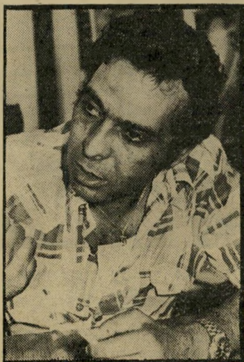
איש-עסקים מרגנית בלי פוליטיקה

רחל הגיע לעצמונה מהתנחלות גוש-אמונים בקדומים. הוא אומר: "אני מאמין שהמצאות שלנו כאן תביא לכך שלא יהיה פינוי. אני מאמין שהמעשה הזה, ומעשים דומים, של עשייה ממש, ישפיעו על התודעה הלוקיית של העם, ודרך תיקון התודעה נגיע להשפעה על הממשלה. הן החדשה, אזנה כרוייה לציבור. בסבסטיה בקדום הצלחנו לא מפני שקבוצה קטנה הפחידה את הממשלה. זה היה חוד קניית שביטא את העם. אני מאמין שברגע הי