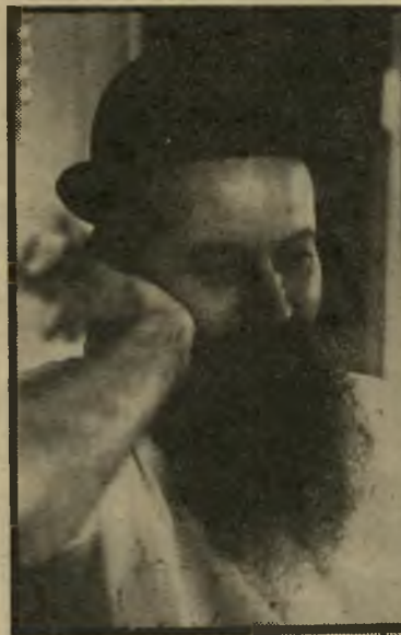
מושבינק נקר משדות ורב רחז מעצמונה שלום מול שלימות הארץ

מתוני המדיניות של המערך הם שהחליטו על הקמת המשבים וזו עיירה ימית. פיתחת-רפיח נועדה לשמש