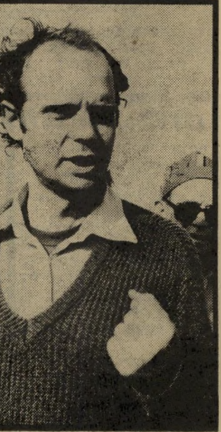
משורבב בן בטעות

הננו להעיר, כי שמו של מר בן שורבב לשער האחורי ע"י העורך הגראפי שלנו, העורך ה-