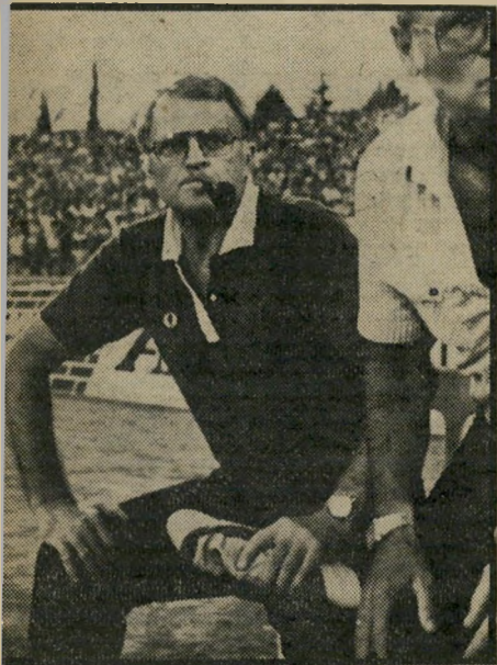
מאמן מנסל איפוק אנגלי