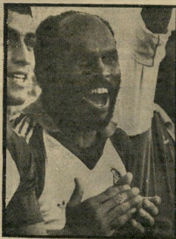
שחקן טורק אולר במיסעדה

שער רביעי לזכות ישראל. מאמן הנבחרת ועוזרו עקבו אחר השחקנים במתח בלתי-נסבל. מבטיהם ננעצו בשעון: "כמה זמן נשאר? מתי הסיוט הזה כבר ייגמר?" כמו ביהוד, הפסקה. התוצאה 4:1 מתאימה לסיום מישחק. אבל עם סופה חזרו כולם למיגרש. בן-דורי שיתף את