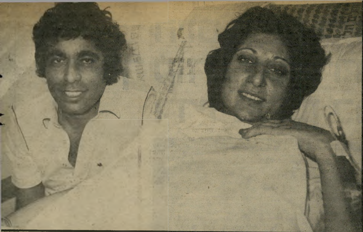
המדה ויעקב שבת למחרת לידת החמישייה לא עושים את הפירסומת בשביל כסף

הרופאים משלימים עם הפירסום, משום שהידיעה יכולה להביא בעלי-יממון לתרום כסף לרווחתם הכלכלית של בני-הנוג.