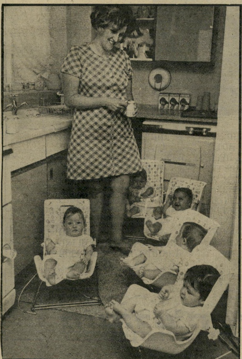
אירן האנפן והחמישייה שלה החמישייה הראשונה בעולם

כמה שנים, אך הצליחה אחרי טיפול הורמונאלי. הנשים הזוכות בטיפול הורמונאלי הן אלה שבשחלה שלהן לא מתרחש ביוץ. ההפרעה יכולה להתבטא בהיעדר מוחלט של וסת או במחזורי-הידישי בלתי-נוספים. ייתכן גם, היעדר כל תופעות לוואי השיטה הפשוטה ביותר להיווכח שאין ביוץ היא בעזרת מדידת חום-גוף. מדי