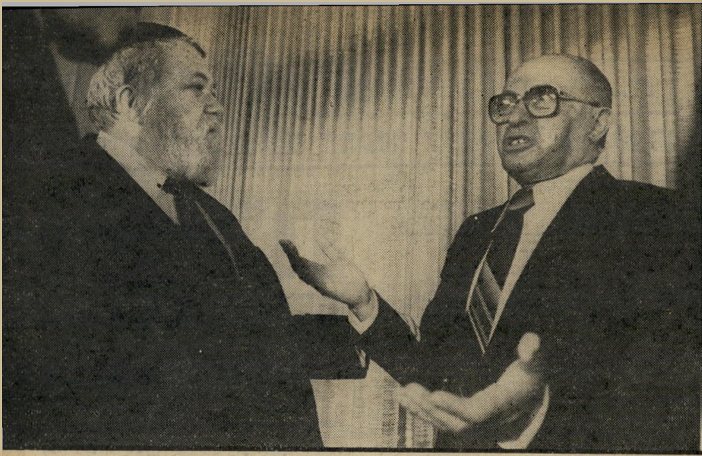
ראשי-הממשלה בנין וראשי-קואליציה שפירא כסף דוחה שבת

תשלום החוב, הפכה היריבות בינו ובין אל-על שינאה ממש. כשמונתה על-ידי בגין וקורפו הוועדה, שתפקידה הוא להכריע את גורל אל-על, לחצו ראשי אגודת דתי-ישראל לצרף אליה גם את ויינגרטן. בומה שביט נזעק וסיפר לבגין את תולדות היחסים בין אל-על ובין הרב מני-יורק, אולם לחץ המפלגות הדתיות היה חזק מטענותיו של שביט. ויינגרטן צרף לוועדה והוא למעשה מנהל אותה.