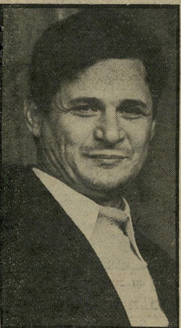
שר-אוצר ארידור בגין יחליט

כל ברור שחברת-תעופה בינלאומית אינה יכולה לז' תר על יום וחצי בשבוע. הפסד ההכנסות הוא מעבר ליום וחצי זה. אנשים אינם מוכנים לרכוש כר' טיסים בחברת-תעופה שאינה מבי טיהא להם שירות יומי קבוע. יצואנים וחקלאים אינם מוכנים לעבוד עם חברת-תעופה שאינה מוכנה להתחייב להטיס את המיט' ען שלהם בכל אחד מימי השבוע. את כל זאת מבינים לא רק מומי' חי-התעופה, אלא גם שרי-הליכוד.