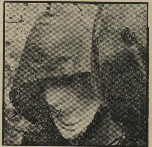
מנהיג החזית במחנה-אימונים מבצעים + עיתונות = תודעה ציבורית

קצת קשה לסלוח להם, לכן, על ההזנחה וההתעלמות