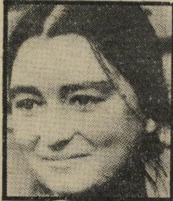
זינה פרונדובה פעם הבאה — רצח!

לעומתו מגלה המנהיג ההונגרי, יאנוש קאדאר, זהירות רבה נוכח גילויי האהדה המתרבים והולכים בהונגריה למאבקי סולידאריות.